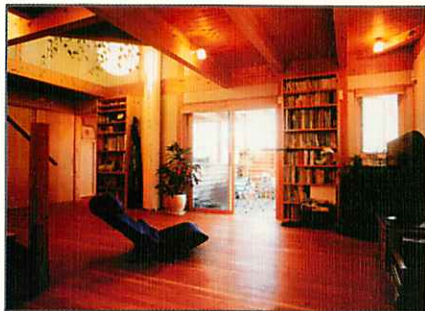
○小国杉を使用した施工例