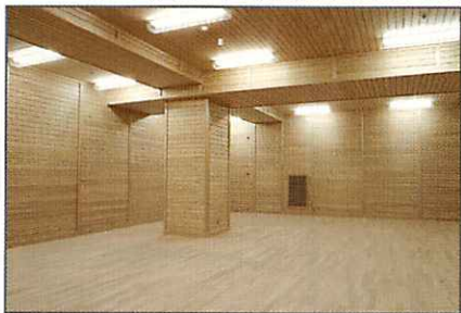
○九州国立博物館収蔵庫

小国杉は、強度に優れ艶と粘りのある材質です。人肌に近い温度が体感でき、人の手や陽射しに触れあめ色の風合いが増します。木が発するフィトンチッドという芳香性の物質は、森林浴と同じリラックス効果を得ることができ、アレルギーの原因の一つと言われるダニの行動を抑制したり、殺菌作用、カビ防止の効果もあります。